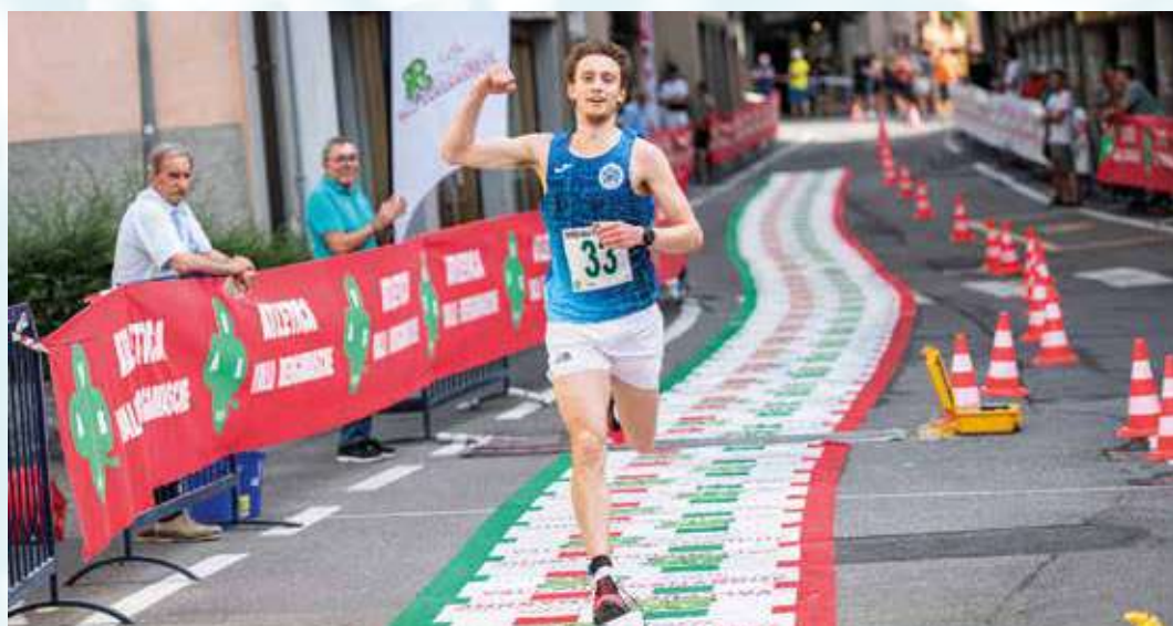
L'arrivo dell'U.S. Malonno nell'edizione 2022