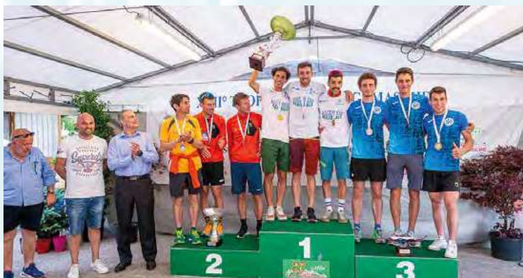
Il podio del campionato regionale 2022