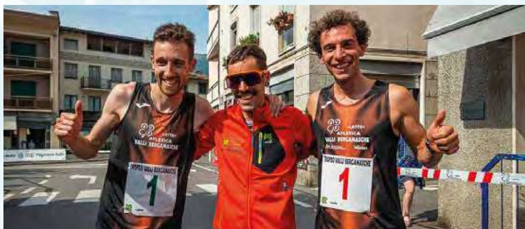
I vincitori del Trofeo valli Bergamasche 2022