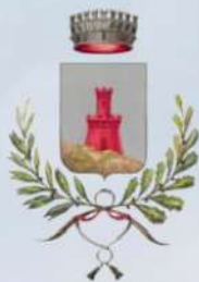
Comune di Rogeno