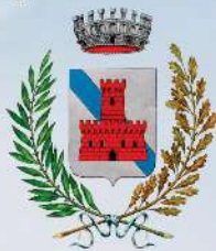
Comune di Merone