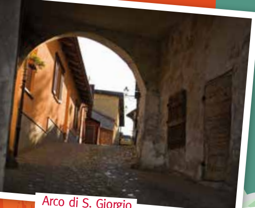
Arco di S. Giorgio