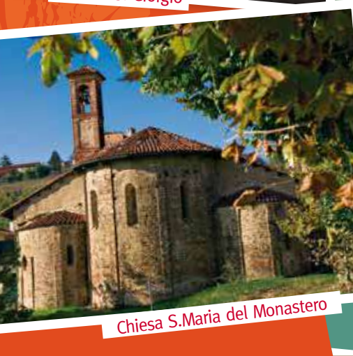
Chiesa S. Maria del Monastero