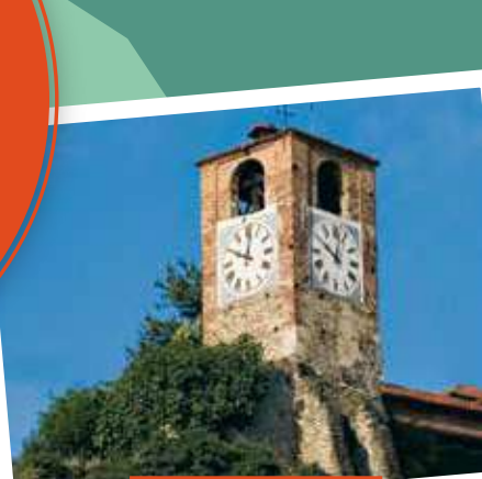
'I Cioché d'le ronsee