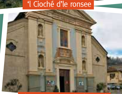
Chiesa S. Maria degli Angeli