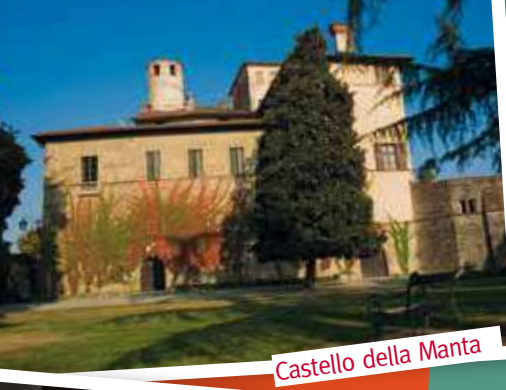
Castello della Manta