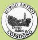
Borgo Antico Cossogno