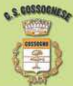
Gruppo Sportivo Cossognese