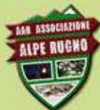
Associazione Alpe Rugno