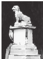
ASSOCIAZIONE VIVERE CASTELLAZZO