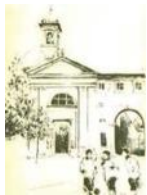
PARROCCHIA SAN GUGLIELMO CASTELLAZZO